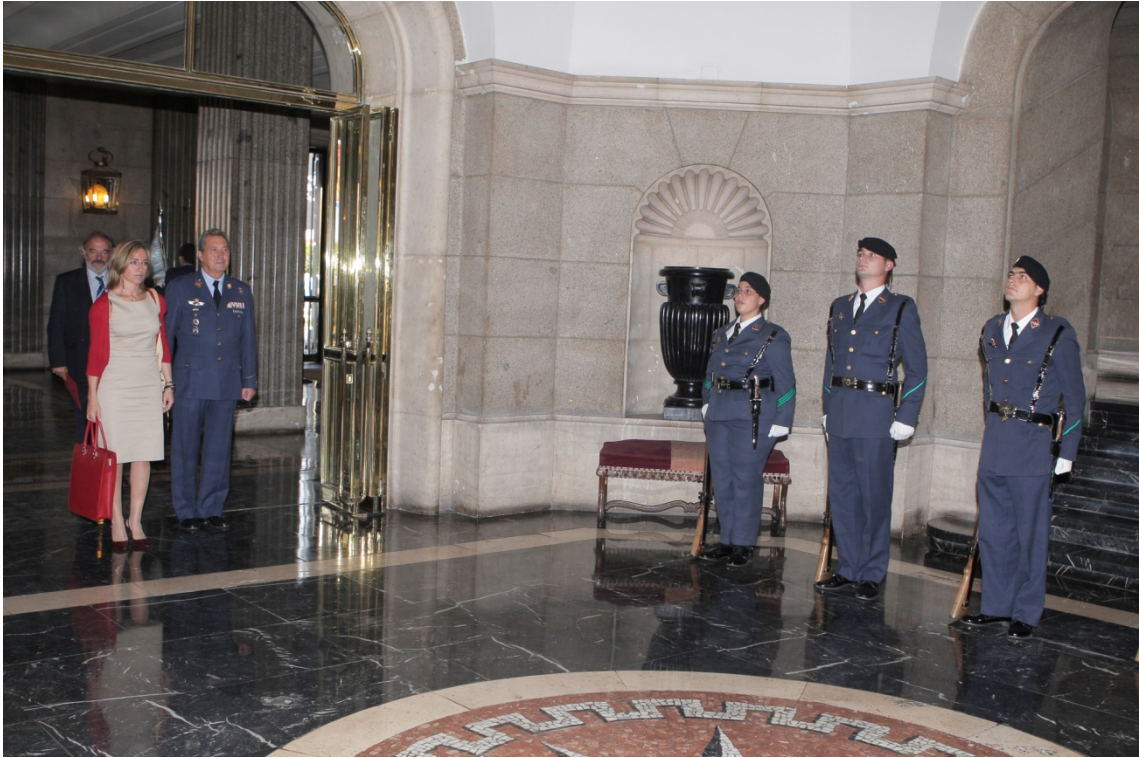
Hall principal de entrada. El JEMA acompañando a la Ministra de Defensa