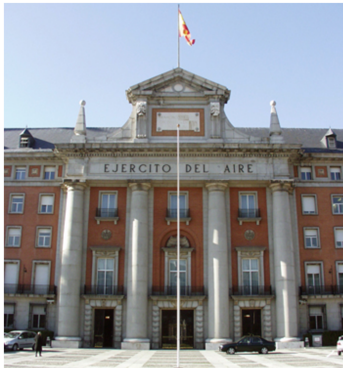
Fachada principal del CGEA (en la Lonja de Moncloa)