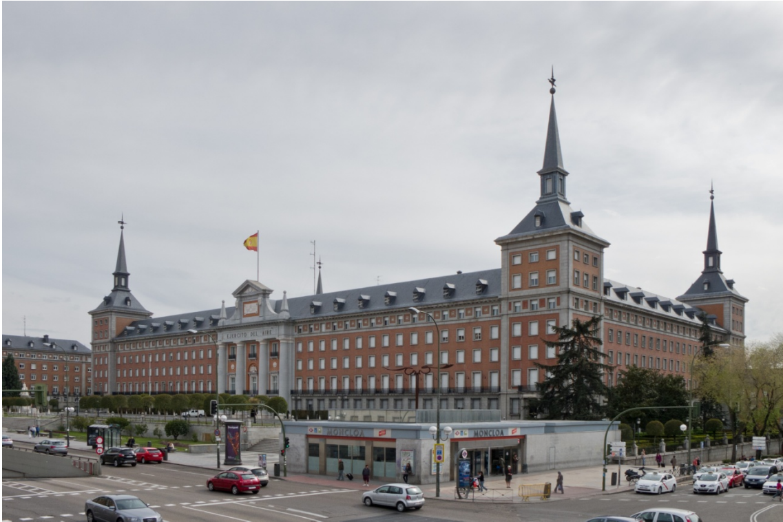
Vista del CGEA con el llamado Intercambiador de Moncloa en primera línea