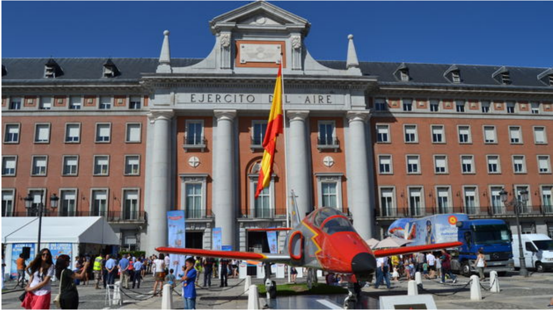
Día de Puertas Abiertas en la Lonja de Moncloa