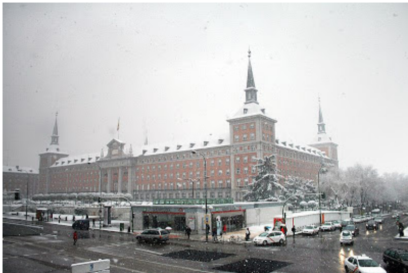
El CGEA un día de nieve en abril de 2009