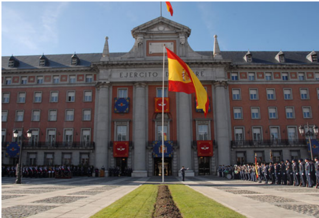
Escuadrilla de Honores del EA en la Lonja de Moncloa en una parada militar