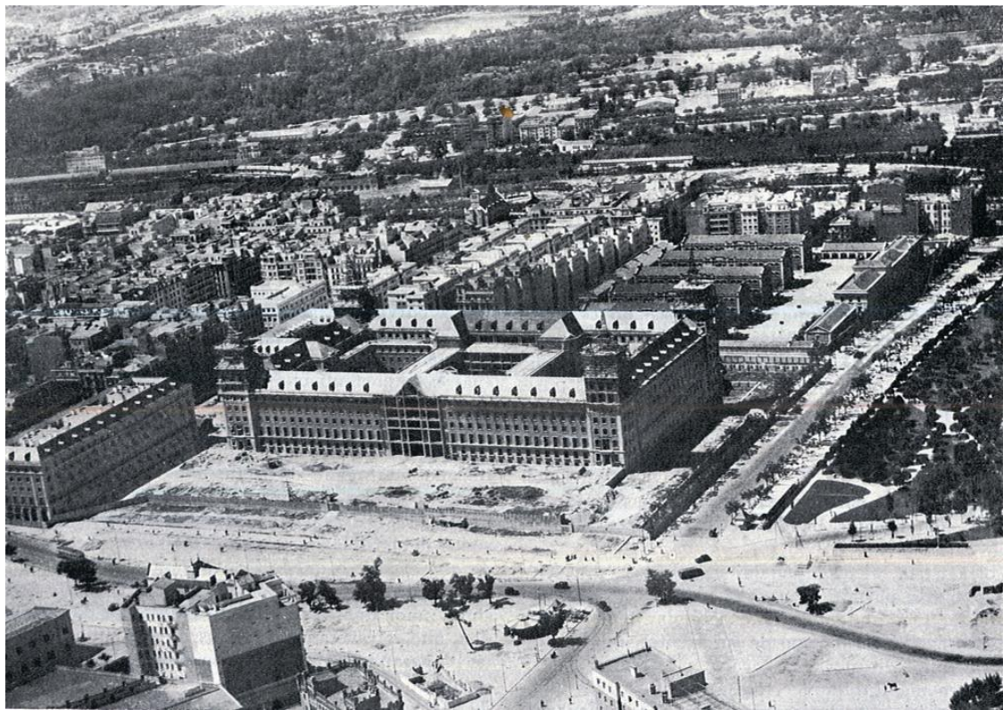
El Cuartel General del EA en construcción