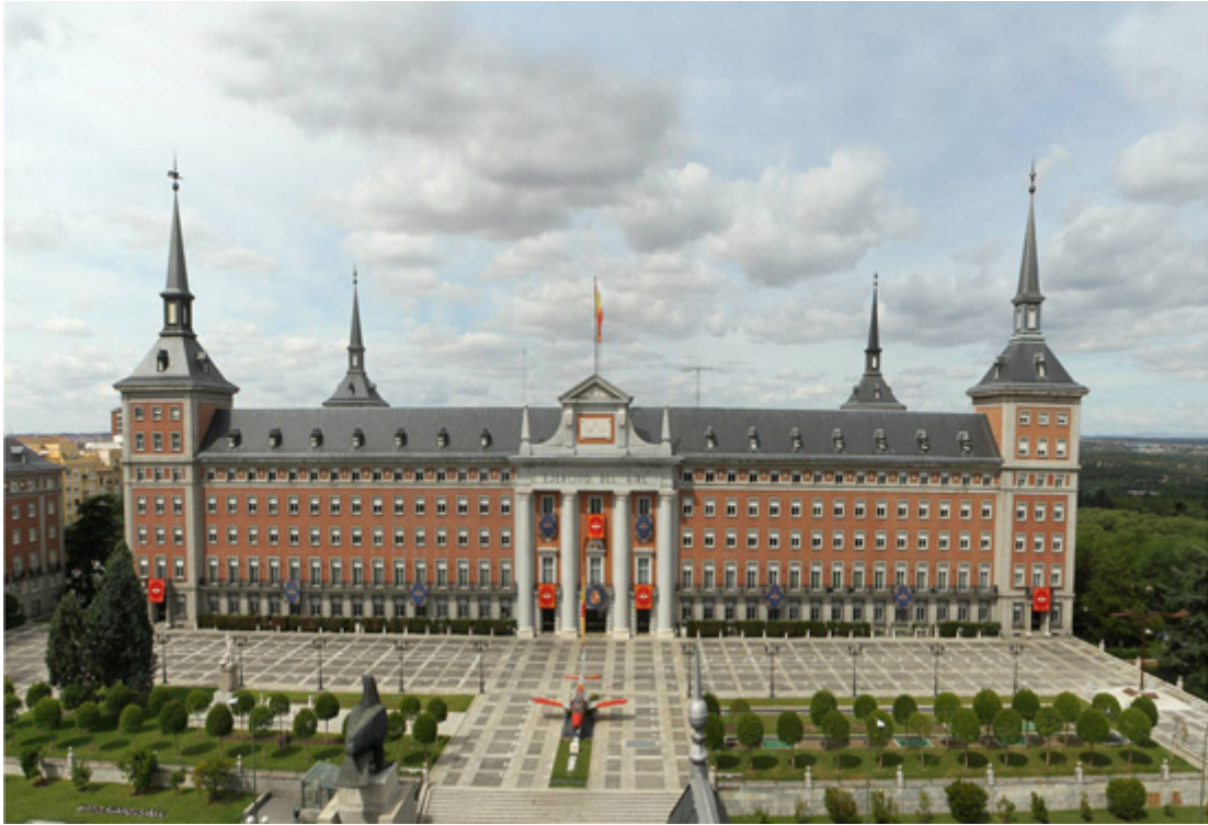
Fachada principal del CGEA con engalanado general y la llamada Lonja de Moncloa (Plaza de Armas) con un avión C-101 en primera línea