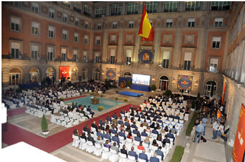
Patio de Honor en el interior del CGEA. Celebración del Acto de Entrega de los "Premios Ejército del Aire"